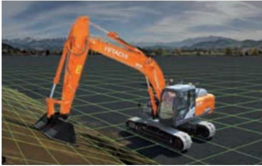
位置情報により掘削面を認識。

3D設計データに基づいて、モニタや音による操作ガイダンス(マシンガイダンス:MG)を提供するシステムです。衛星測位および姿勢センサによる機械の位置・姿勢情報を必要とします。